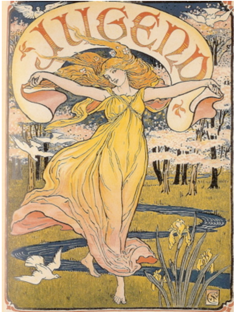
Walter Crane, Jugend 1898. Marbach am Neckar, Schiller-Nationalmuseum

sche zich op zijn zwerftochten alleen laat leiden door de stand van zon, maan en sterren, hoppend van de ene tijdelijke verblijfplaats naar de andere, altijd bezig met het opnemen van indrukken, zonder ooit het verlangen te koesteren zich ergens voor goed te vestigen en oud te worden. De grote schrijver Thomas Mann wijdde aan de Duitse sehnsucht en de tragische ondergang van de Duitse geest een roman met meer diepgang, een magnum opus: Doktor Faustus . 21 Zelf sprak hij van een “Lebens- und Geheimwerk”. 22 Zijn hoofd-