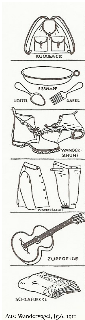
Aus: Wandervogel, Jg.6, 1911

wandeltochten maakten in het Grunewald. De beleving van de vrije natuur leverde veel stof voor diepzinnige gesprekken over religie, schoonheid, moraal en natuurlijk ook over de eigen toekomst. Tot grote ergernis van de burgerij trokken zij in de weekends al voor dag en dauw onder luid gezang de stad uit. Wandervögel noemden zij zich. 7 Hun aantal verdubbelde elk jaar. Ze liepen langs stille akkers en over uitgestrekte velden. Ze luisterden naar de leuweriken en dansten met de boeren op het oogstfeest, ze sliepen in het hooi en kookten hun eten op een primitieve spiritusbrander of op een kampvuur. Bovenal wilden ze lopen, soms marsen van 50 km of meer, het zogenaamde ‘Klotzen’. Ze trokken in de omgeving van de steden in groepen rond, veelal jongens en meisjes door elkaar, met losse haren en blote benen. Ze zongen oude volksliederen onder begeleiding van met kleurige linten versierde mandolines. Romantische gevoelens hadden ze. Zo vrij als vogels voelden ze zich. Zomers trokken ze nog verder weg, van Skandinavië tot Sicilië werd er dan ‘geklotzt’.