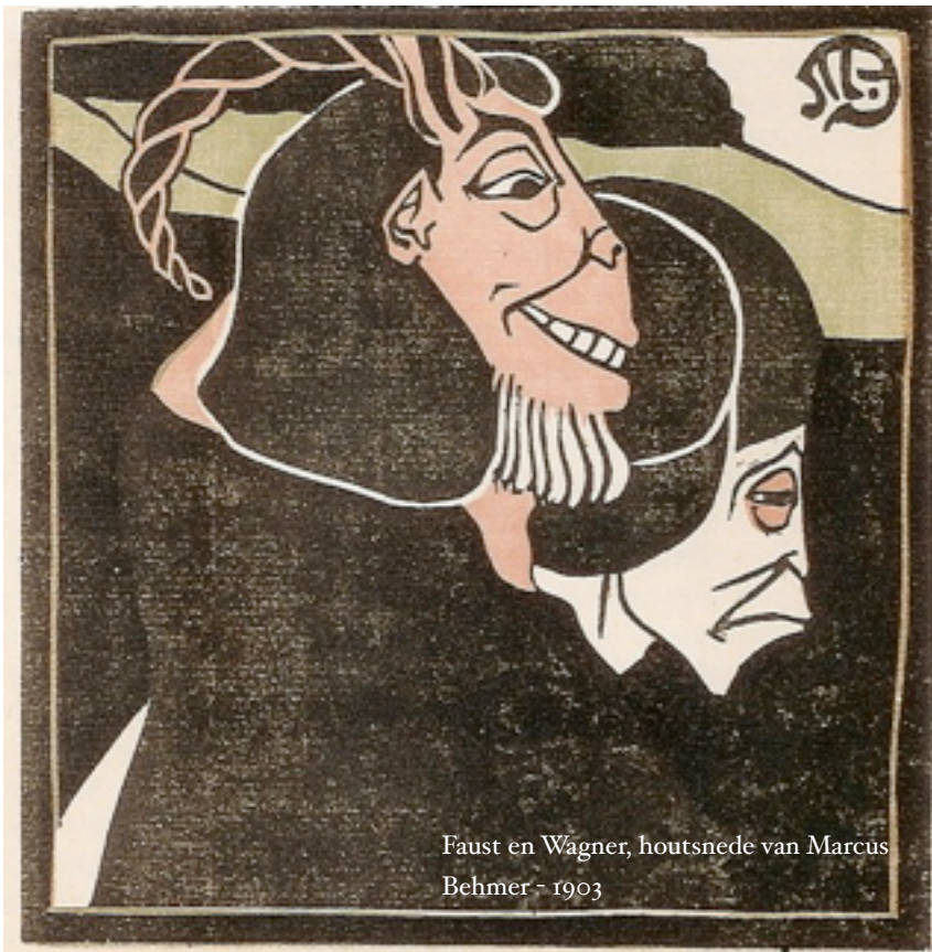
Faust en Wagner, houtsnede van Marcus Behmer - 1903

De schoonste paradijzen zijn die, welke voor goed verloren zijn gegaan. Zij geven aan de herinnering een glans die er in werkelijkheid niet is geweest. Zich iets uit een ver verleden voor de geest halen behoeft niet altijd te bestaan uit het in chronologische volgorde noemen van feiten, maar kan ook een reis zijn die in de verbeelding wordt afgelegd. Een speurtocht in de eigen binnenwereld langs oude paden op zoek naar de oorsprong van de dingen, naar de eerste en nog maagdelijke zintuiglijke indrukken van een steen, planten,