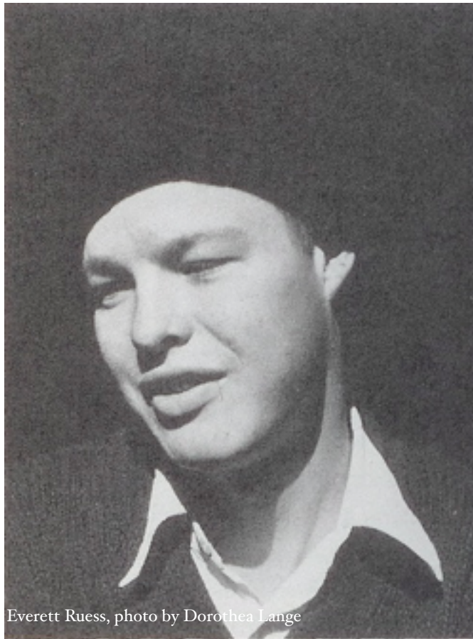
Everett Ruess

Op een eenzame plek in het berglandschap van Escalante, Zuid-Utah, staat in een rotswand gekrast: Nemo 1934. 'Ik ben niemand'. De schrijver van deze geheimzinnige woorden was de legendarische canyondichter Everett Ruess die met zijn ezels in dit woeste gebied veel rondzwierf. 1 Bij zich droeg hij een roman van Jules Verne over de gewaagde avonturen van kapitein Nemo, derzeeër de Nauidiepte dook. 2 De inscriptie was een laatste teken van leven. Nooit meer iets van hem. Slechts een paar ners menen bij hemel, op paden hoogten voeren, silhouet van hem zien. Kunstschilder Ruess worden. had hij niet gezou blijken dat pen overweg kon. tochten door de hij prachtige nasolitude I can the mountains work or think, my whim, and between me and the Wild". 3 Ook Amerika kent zijn romantici.