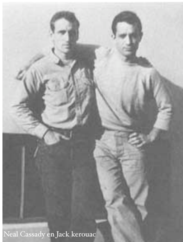
Neal Cassady en Jack kerouac

De jeugdige Jack Kerouac wilde het niet bij woorden laten. Op zoek naar "kicks" en "diggings", sleutelwoord beatnik, trok hij met in zijn ransel manuscript voor On tisch werk. Een moed en verstand kleinburgerlijke doen. Alleen ietreme zucht naar zo'n boek schrijven. personen, Dean op in een kinderte als Kerouac zelf zoek naar nieuwe levings, seks, jazz, 'Kicks!' ... Momentatische vreugde, 'diggings', gesprekwanten, waarin je