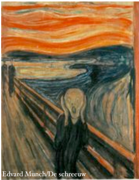
Edvard Munch/De schreeuw

‘Mijn wezen is angst’, schreef Franz Kafka aan zijn vriendin Milena Jesenská. 18 Hij bedoelde niet lichamelijke angst, ook niet de vrees van de bekrompen burgerman voor zijn welstand, maar angst dat hij tekort zou kunnen schieten tegenover zichzelf en tegenover God. Existentiële angst, waarover al eerder in Duitsland de mysticus Johann Georg Hamann en in Denemarken de theoloog Søren Kierkegaard hadden geschreven, denken en leven als één beschouwend. 19 Kafka spreekt treffend van ‘vrees voor de nacht, vrees voor de niet-nacht’. 20 In romans als: In der Strafkolonie , Der Prozess , Das Schloss tekent hij een schrikwekkend ondergangsvision op. Het zijn versleutelde berichten die spreken van eeuwig kwaad dat over de mensen is gaan heersen. Maar - en dat is het bijzondere aan Kafka - hij blijft geloven dat mensen altijd een nieuw begin kunnen maken. Daarom kon hij in één van zijn brieven aan Milena schrijven: ‘Niemand zingt zo zuiver als zij die in het diepst van de hel zijn; wat wij voor het