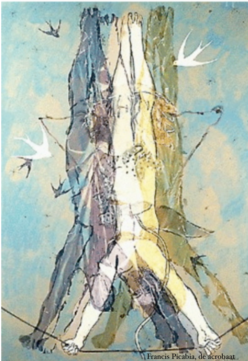
Francis Picabia, de acrobaat

loof heeft. Deze mens vindt dat denken en doen zijn belangrijkste eigenschappen zijn. Ongeordendheid als permanente werkelijkheid ziet hij dan ook als het grootste kwaad.